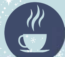
オリジナルドリンク コーヒー他