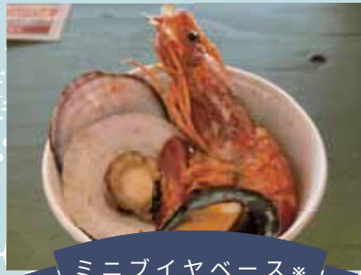
ミニブイヤベース※ 600円

※海カフェたねさし提供 ※具材は季節のものを使用しますので写真とは異なる場合がございます