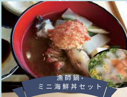
漁師鍋+ ミニ海鮮丼セット