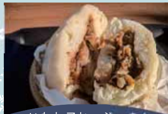
いわシアヒージョまん 麻辣ごま味噌いわしまん