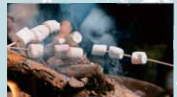
焼きマシュマロ 400円